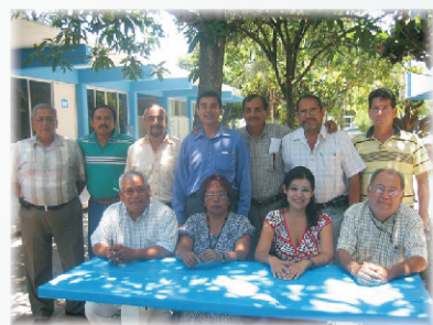
Curso a Docentes