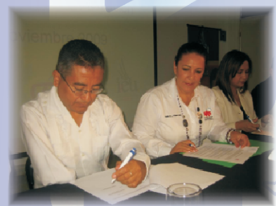
Acuerdo de Vinculación con SAS