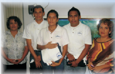
Participantes en el concurso de Creatividad Fase Nacional