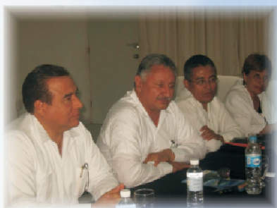
Visita del Director General a nuestras instalaciones