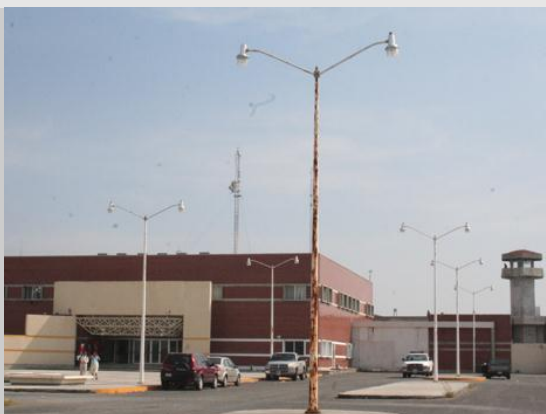
3.- Centro de Ejecución de Sanciones de Altamira, Tam.