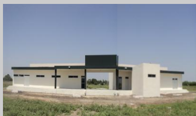
Unidad Académica Soto La Marina, Tam.