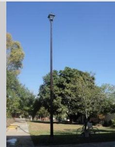
Instalación de equipos eléctrico de alumbrado.