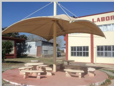
Plazoleta con internet en Ingeniería Civil.