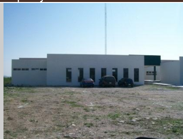
Unidad Académica San Fernando, Tam.