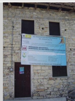
Unidad Académica de Zozocolco, Ver.