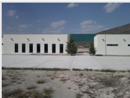
Unidad Académica Tula, Tam.