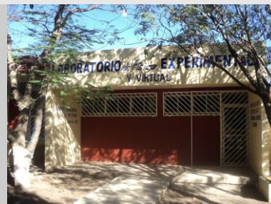
Construcción del Laboratorio de Física Experimental