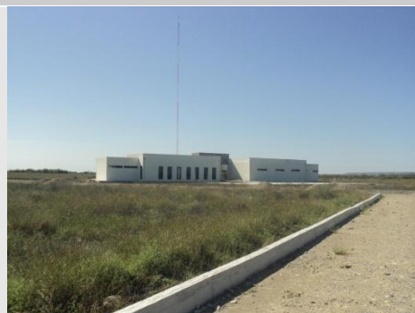
Unidad Académica Abasolo (en construcción)