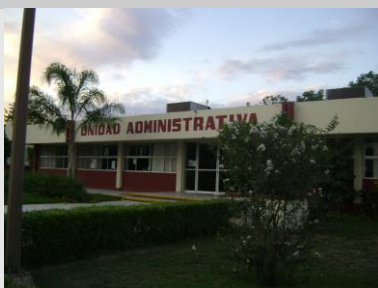
Pintado de Edificio Administrativo