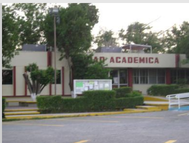
Pintado de Edificio de Unidad Académica