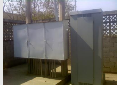
Mantenimiento de Subestación Eléctrica