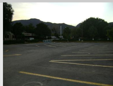
Pintado de vialidades en estacionamientos