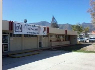
Remodelación de Edificio para ubicar a la Unidad de Posgrado