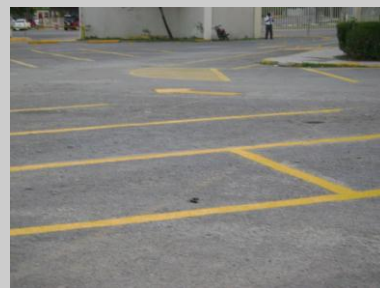
Pintado de vialidades en estacionamientos