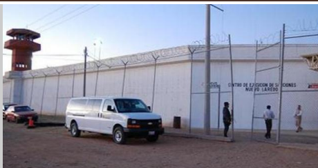
1.- Centro de Ejecución de Sanciones de Nuevo Laredo, Tam.

Memoria fotográfica de los Centros de Ejecución de Sanciones en Tamaulipas, donde el Instituto Tecnológico de Ciudad Victoria imparte algunos Programas Educativos en la modalidad a Distancia.