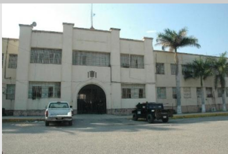
2.- Centro de Ejecución de Sanciones de Victoria, Tam.