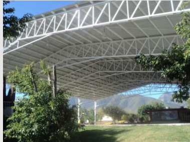
Construcción de la techumbre

Galería fotográfica de las actividades de construcción, remodelación y/o mantenimiento, en el ITCV, durante el año 2011.