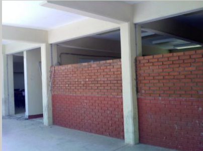
Remodelación de Aulas Inteligentes